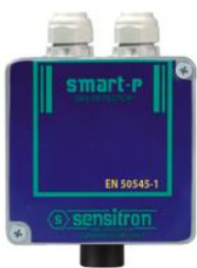
CO or NO 2