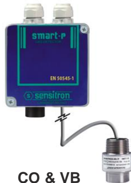
CO & VB