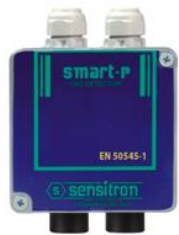
CO & NO 2